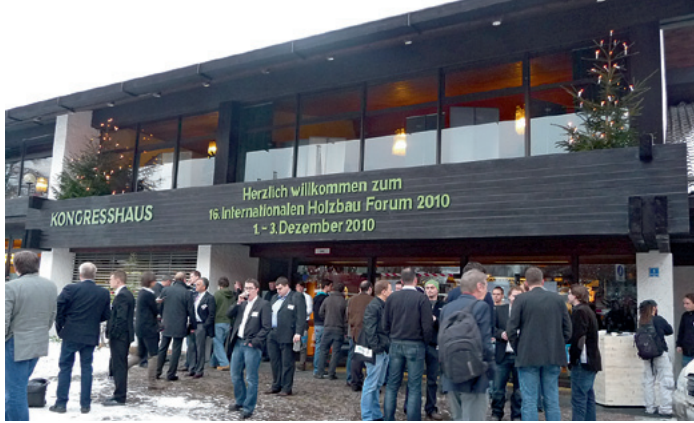
Internationales Holzbau-Forum: Drei Tage drehte sich im Kongresshaus von Garmisch alles ums Holz